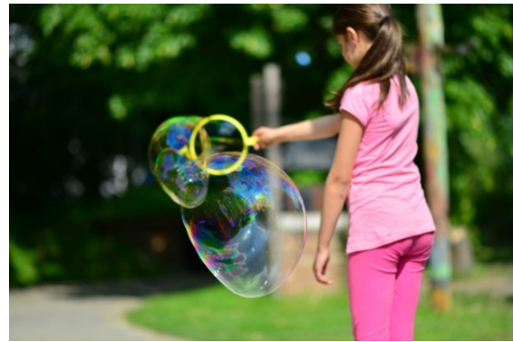
"Oh wie schön sind Seifenblasen"

Neben dieser Kernaufgabe des „Offenen Treffs“ verstand sich die Einrichtung als Ort der Begegnung von Menschen aus dem Südviertel und wurde daher von zahlreichen Einrichtungen, Institutionen und Gruppen sowohl vormittags, abends und am Wochenende aufgesucht bzw. zur Verfügung gestellt.