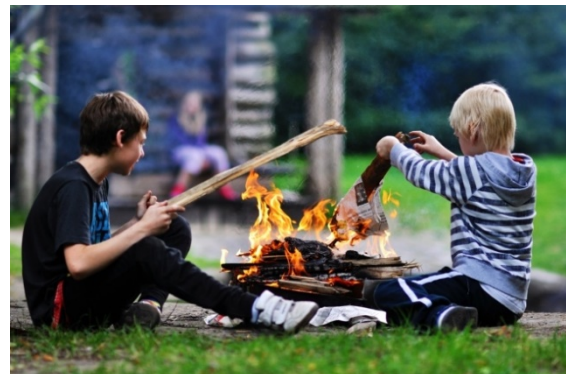
Lagerfeuer im ABI Südpark

Sie beschreiben typische, wiederkehrende Situationen und Abläufe, deren Gestaltung maßgeblich für das Gelingen oder Misslingen der Arbeit ist. Sie beinhalten Übereinkünfte eines Teams/einer Einrichtung über miteinander abgestimmtes Verhalten und Vorgehen in bestimmten Situationen.