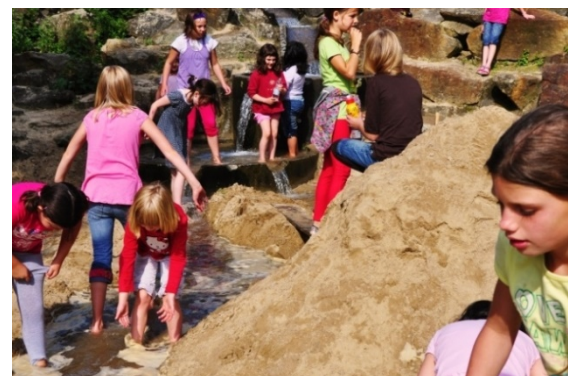
Wasser und Sand

Die ganztägige Ferienbetreuung für Grundschul Kinder in der Zeit von 08:00 – 16:00 Uhr und 20 Kindern pro Woche und das offene Ferienprogramm waren fester Bestandteil der Angebote in den Schulferien. Sie fanden an insgesamt sieben Wochen statt. Das offene Ferienprogramm in den Oster-, Sommer- und Herbstferien besuchten in den sieben Wochen (33 Tage) insgesamt 2.148 (2018: 2.405) Kinder (695 weiblich/1.453 männlich).