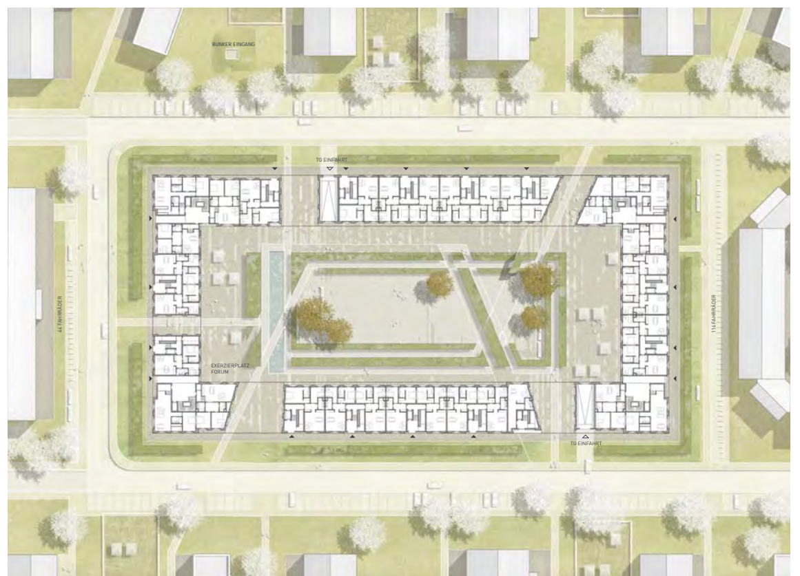
WOHNEN AM EXERZIERPLATZ M 1:500