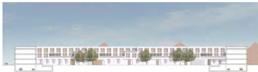
LÄNGSSCHNITT WOHNEN AM EXERZIERPLATZ M 1:500