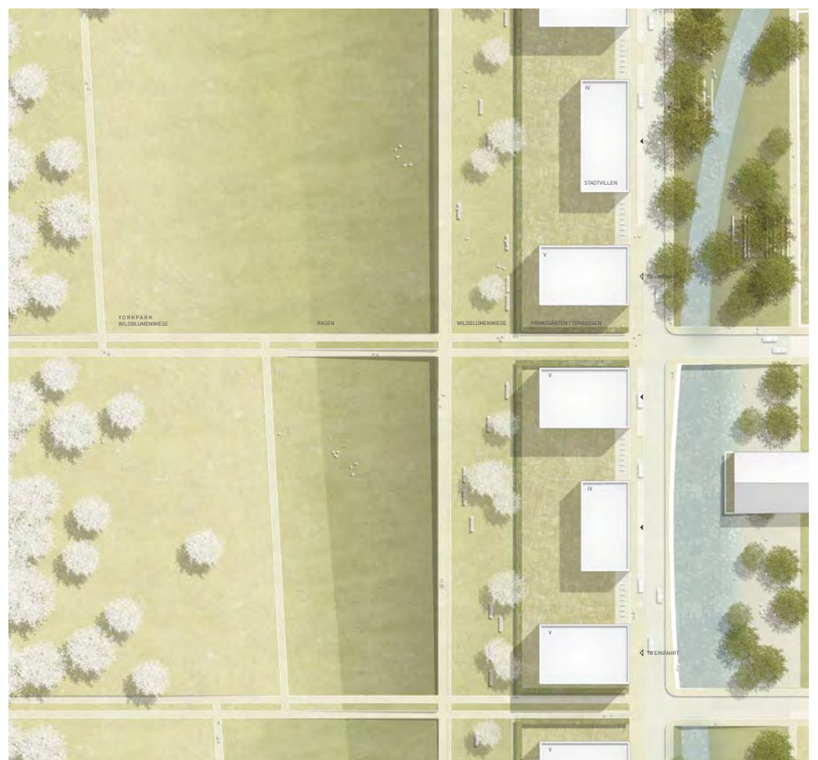
ÜBERGANG ZU DEN WALDWIESEN IM WESTEN M 1:500