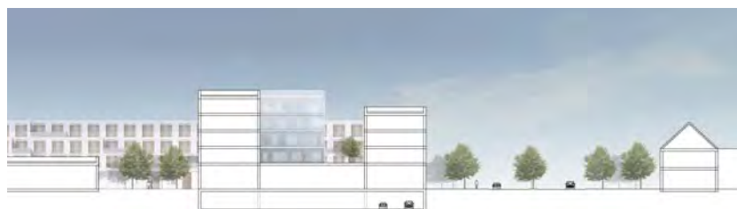
QUERSCHNITT ALBERSLOHER WEG M 1:500