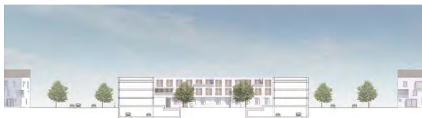
QUERSCHNITT WOHNEN AM EXERZIERPLATZ M 1:500