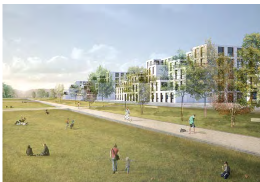
WOHNEN AN DEN WALDWIESEN