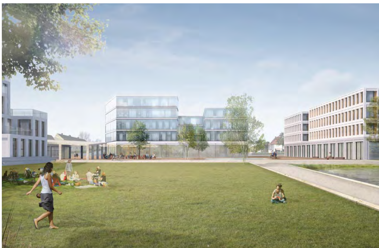
STADTPLATZ YORK KASERNE