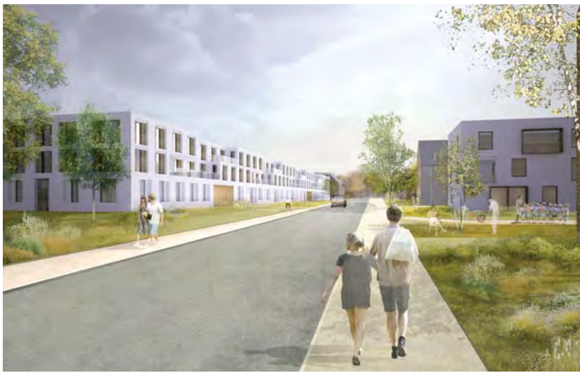
WOHNEN AM EXERZIERPLATZ