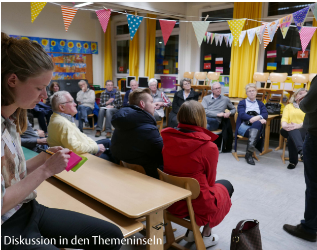
Diskussion in den Themeninseln