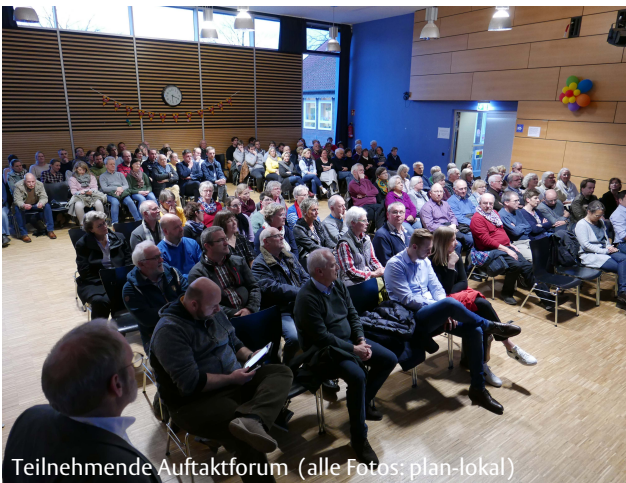
Teilnehmende Auftaktforum

Herr Franke erklärt, dass der Zeitpunkt für die Erarbeitung eines Stadtteilentwicklungskonzeptes gut gewählt sei. In den letzten Jahren sei in Nienberge und Häger kaum gebaut worden. Die zahlreichen Planungen und Entwicklungen im Stadtbezirk Münster-West (Oxford-Kaserne in Gievenbeck, östliche Siedlungserweiterung und Zukunftswerkstatt in Albachten, Wohnbauentwicklung auf dem ehemaligen Beresa-Gelände in Mecklenbeck) werden den Bezirk auch zukünftig nachhaltig wachsen lassen.