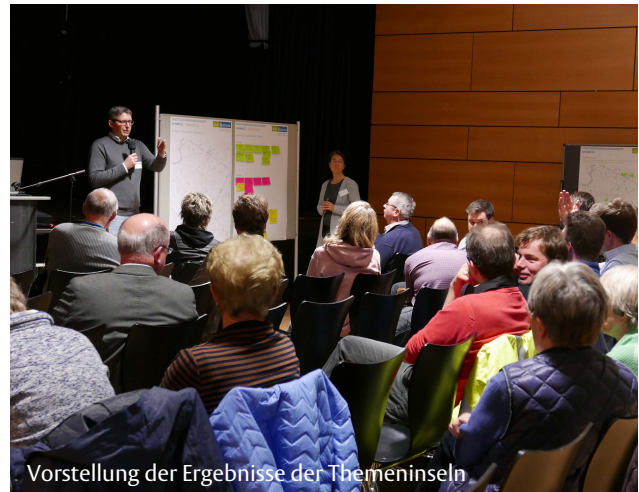
Vorstellung der Ergebnisse der Themeninseln