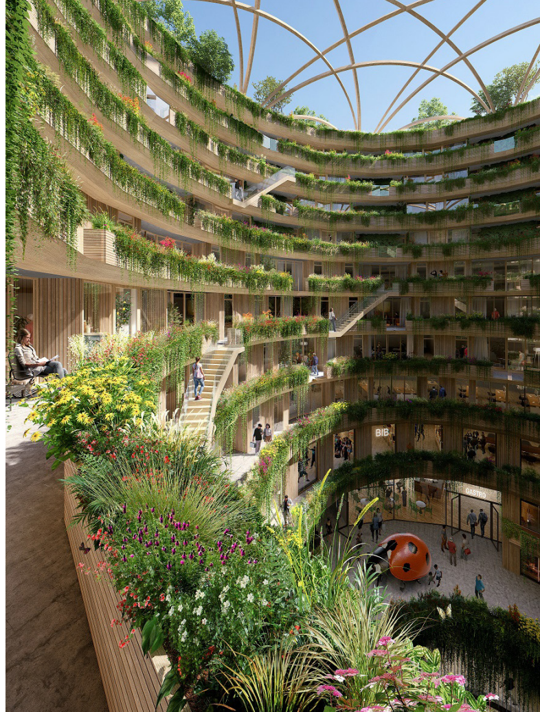
Visualisierung: WAX Architectural Visualizations / UTB