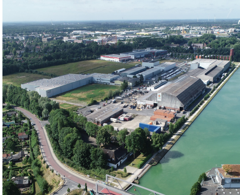
Quartier an der Theodor-Scheiwe-Straße.

Dieser Planungsschritt wurde am 13. Dezember 2023 vom Rat der Stadt Münster beschlossen. Die öffentliche Beschlussvorlage V/0378/2023 beinhaltet zudem die Dokumentation des Werkstattverfahrens sowie ein Mobilitätskonzept für den Bereich der Stadthäfen. Beide Dokumente finden Sie auch auf unserer Projektwebsite. Weiterhin hat der Rat mit der Vorlage modifizierte städtebauliche Kennwerte für das Quartier an der Theodor-Scheiwe-Straße beschlossen. Entstehen könnten dort etwa 1.350 Wohneinheiten. Hintergrund ist, dass das Unternehmen Osmo Holz & Color seine bestehenden gewerblichen Betriebstei-