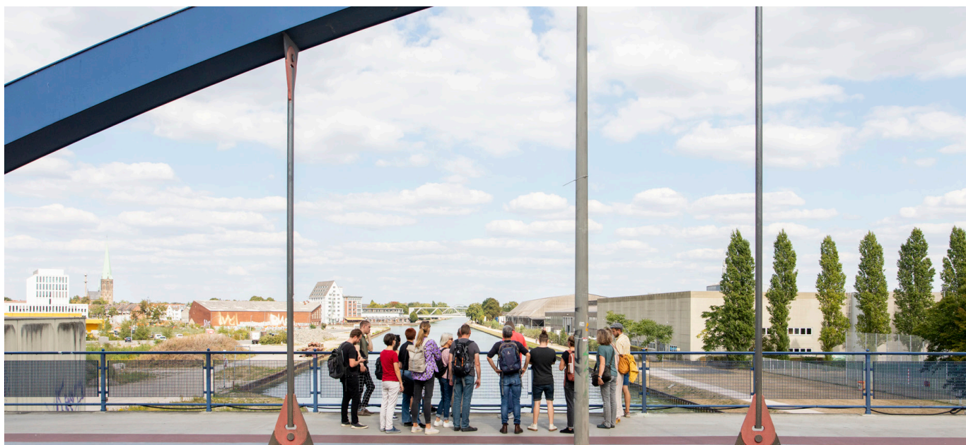
Ein Kanalspaziergang bildete im September 2022 den Auftakt zum Werkstattverfahren.

Projektwebsite Beschlussvorlage im Ratsinformationsdienst