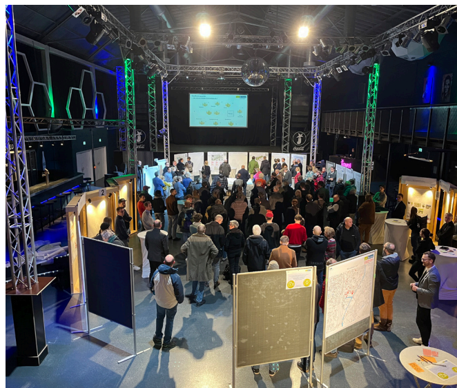
Austausch im Jovel.

Bis zum 18. Dezember sind die Bauleitplan-Vorentwürfe samt städtebaulicher Konzeption sowohl im Kundenzentrum Planen und Bauen (Stadthaus 3, Albersloher Weg 33) als auch online einsehbar.