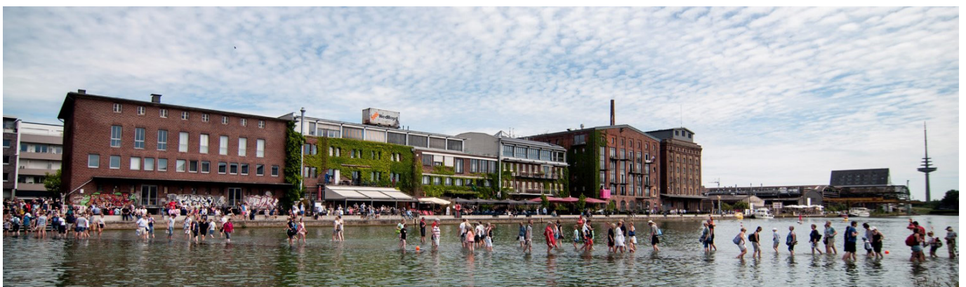
Steg über das Hafenbecken: Ayşe Erkmen, Skulptur Projekte 2017.

Da der Rat der Stadt Münster in der Sitzung am 13. Dezember 2023 die Verwaltung u. a. beauftragt hat, eine Wegeverbindung in Form einer Ponton-Brücke über den Stadthafen 1 zu prüfen, wird sich die AG zudem mit dieser Idee auseinandersetzen.