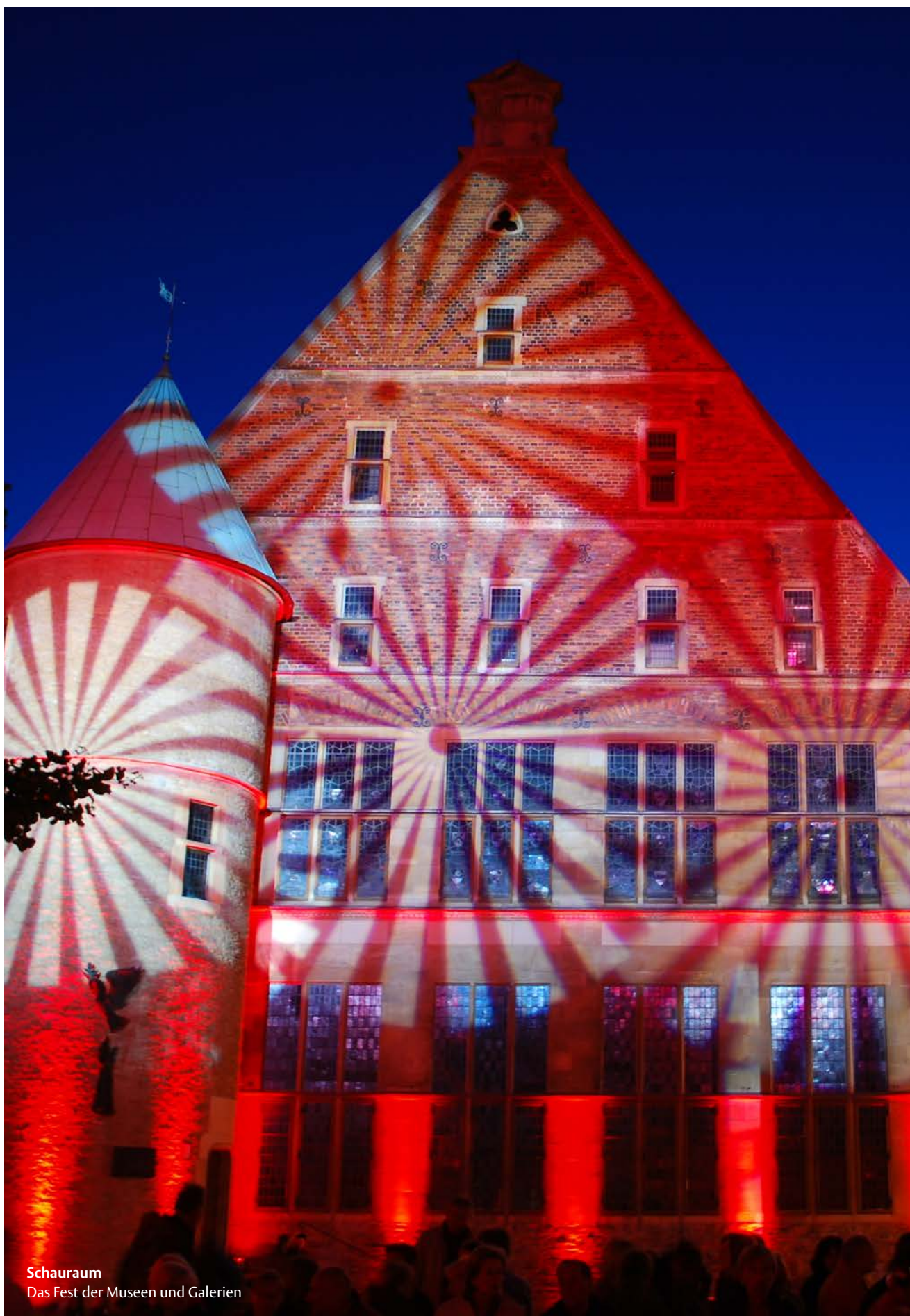
Schauraum Das Fest der Museen und Galerien