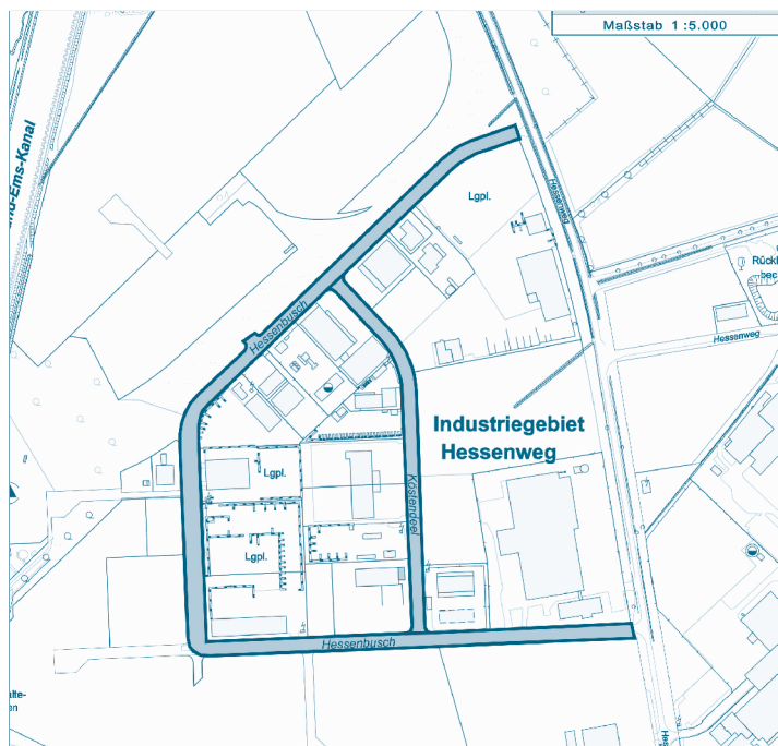
Übersichtsplan Nr. 1

Gemäß § 6 (1) Straßen- und Wegegesetz NRW werden die im Eigentum der Stadt Münster stehenden Straßen Hessenbusch und Köstendel dem öffentlichen Straßenverkehr gewidmet.