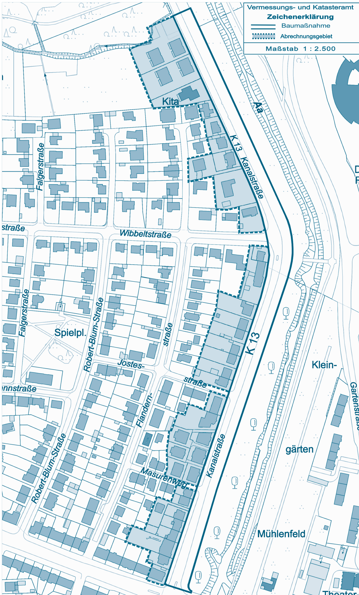
Übersichtsplan Nr. 4