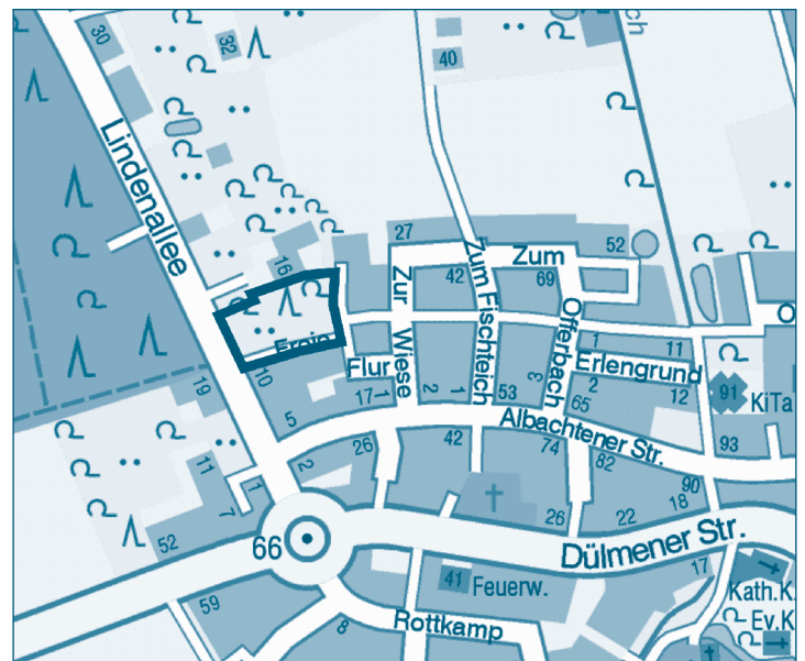
Übersichtsplan Nr. 2: Bereich des Bebauungsplans Nr. 602

Des Weiteren wird gemäß § 13a Abs. 3 BauGB bekanntgemacht, dass der Bebauungsplan im beschleunigten Verfahren ohne Durchführung einer Umweltprüfung nach § 2 Abs. 4 BauGB aufgestellt wird.