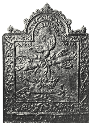
„Pax Optima Rerum“, haardplaat, Stadtmuseum Münster

Ter herinnering aan het sluiten van de vrede in 1648 bevindt zich in de zuidelijke muur in de zuidelijke muur een gietijzeren kachelplaat van een meter hoog, die in het midden een kussen met kroon en scepter toont waarboven drie duiven met olijftak in de snavel te zien zijn. De inscriptie luidt: „Anno 1648. Pax optima rerum, 24 Oct.“ (Vrij vertaald: „Vrede is het hoogste goed, 24 oktober 1648.“)