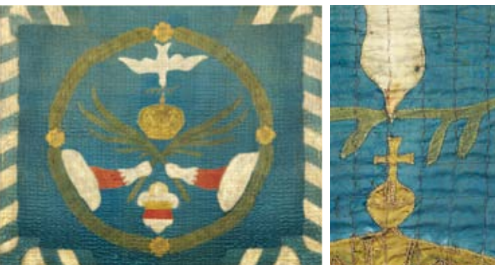
Gereconstrueerd: De Münsterse vredesvlag van 1648

Op initiatief van de Stadtheimatbund Münster is op een stuk stof een reconstructie vervaardigd die opnieuw de oorspronkelijke kleuren weergeeft. Op een blauwe achtergrond is een groene lauwerkrans afgebeeld die vier symbolen omvat: een witte duif met een groen takje in de bek, de Habsburgse gouden keizerskroon, twee handen in witte handschoenen die elkaar palmtakken als vredessymbolen overhandigen en het stadswapen van Münster in de kleuren goud, rood en zilver. De vredesvlag geldt als een icoon van de stadsgeschiedenis.