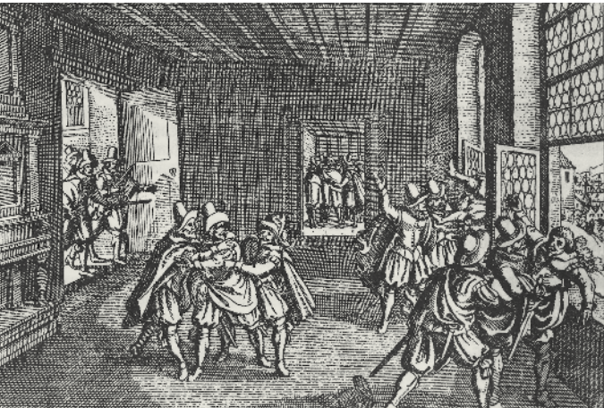
De Defenestratie van Praag, Stadtmuseum Münster

Directe aanleiding was de Defenestratie van Praag , waarbij Boheemse edelen de stadhouders van de katholieke koning Ferdinand II uit een raam van het kasteel in Praag gooiden. Toen vervolgens de calvinistische keurvorst Friedrich V von der Pfalz gekozen werd tot koning van Bohemen breidde het regionale conflict zich uit over het gehele Rijk.