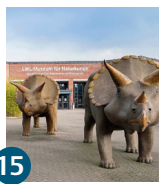
15 LWL-Museum für Naturkunde mit Planetarium