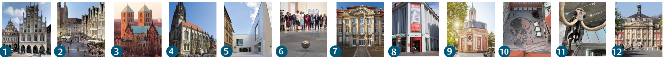
1 Historisches Rathaus 2 Prinzipalmarkt 3 St. Paulus-Dom 4 St. Lamberti 5 LWL-Museum für Kunst und Kultur 6 Dominikanerkirche G. Richter Pendel 7 Erbdrostenhof 8 Stadtmuseum 9 Clemenskirche 10 Kunstmuseum Pablo Picasso 11 Geomuseum 12 Schloss