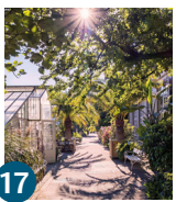
17 Botanischer Garten