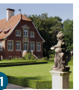
21 Haus Rüschaus

Münster Süd (78) BAB 1 Dortmund BAB 43 Recklinghausen