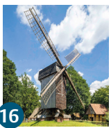
16 Freilichtmuseum Mühlenhof