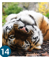
14 Allwetterzoo mit Pferdemuseum