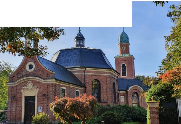
Münster - Dyckburgkirche