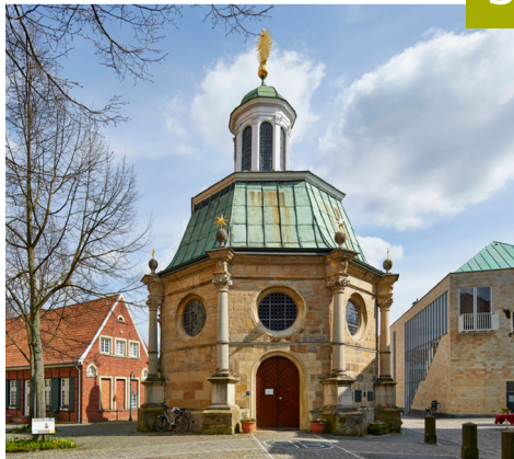
Telgte - Wallfahrtskapelle