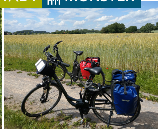
Unterwegs mit dem Fahrrad